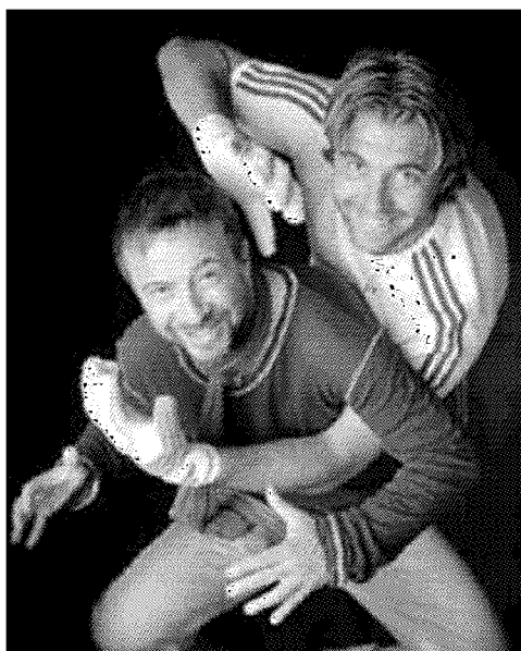
Forza Viola Frey mentre «para» un tifoso doc della Fiorentina: Marco Masini

Ventiquattro mesi con Cesare Prandelli & C. Per festeggiare il decimo compleanno dell'Associazione Tumori Toscana 12 mesi non sono bastati e il calendario «Insieme nelle sfide più difficili» ne copre 24 (da novembre 2009 a ottobre 2011). I 48 testimonial hanno posato davanti all'obiettivo di Gianni Ugolini per sostenere l'associazione che dal 1999 offre cure domiciliari ai malati di cancro. Il calendario sarà venduto al costo di 12 euro in alcuni negozi, sul sito internet di Att ( www.associazionetumoritoscana.it ) e nelle piazze di Firenze, Prato e Siena oggi, domani e venerdì.